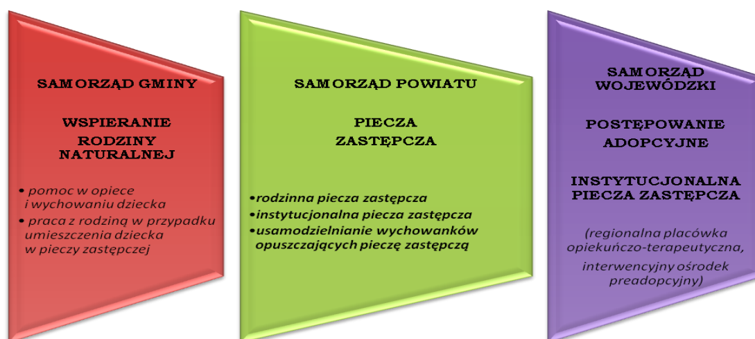
Schemat 1. Organizacja systemu wspierania rodziny i systemu pieczy zastępczej